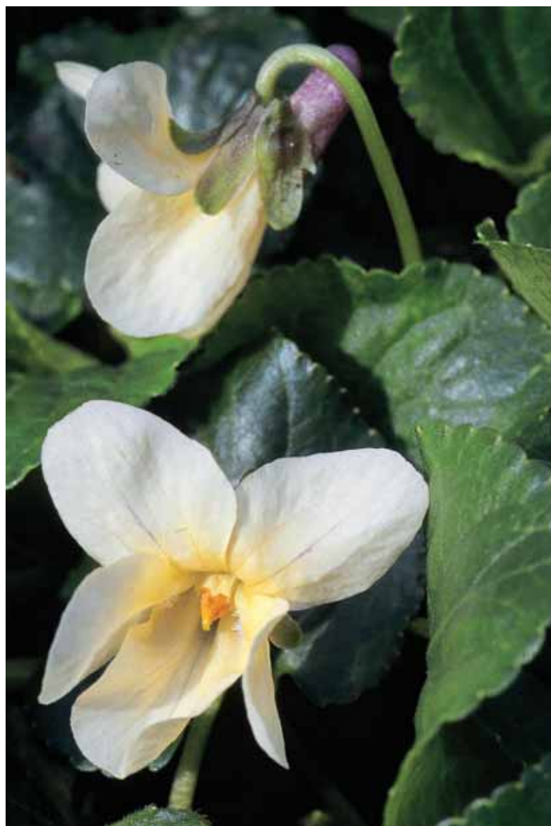
Nicht alle Duftveilchen sind blau: Die Sorte 'Sulphurea' besitzt reizvolle gelbliche Blüten.

Doch der Bedarf nahm laufend ab, und der Zweite Weltkrieg setzte dem Veilchen-Boom endgültig ein Ende. Die Pflanzen waren aus der Mode gekommen und verschwanden in der Folge auch mehr und mehr aus den Gärten. In den letzten Jahren wurden sie von Liebhabern in Europa wiederentdeckt. Ihrem Enthusiasmus ist es zu verdanken, dass heute wieder alte Sorten erhältlich sind, wenn auch erst vereinzelt.