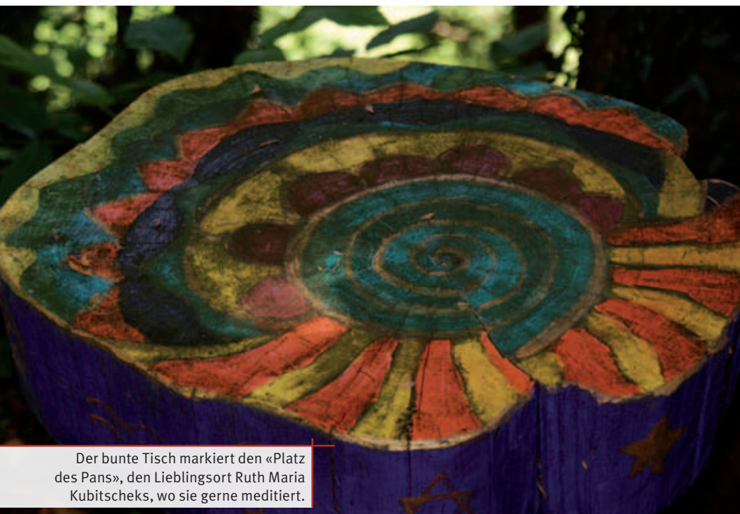
Der bunte Tisch markiert den «Platz des Pans», den Lieblingsort Ruth Maria Kubitscheks, wo sie gerne meditiert.

geschmiedeter Mond sowie eine Sonne. Sie symbolisieren den Kosmos, den Ruth Maria Kubitschek in die Gestaltung miteinbezogen hat. Sie hat Sonnen- und Mondtor selber entworfen und die Symbole eigenhändig vergoldet. Die spirituelle Ausstrah-