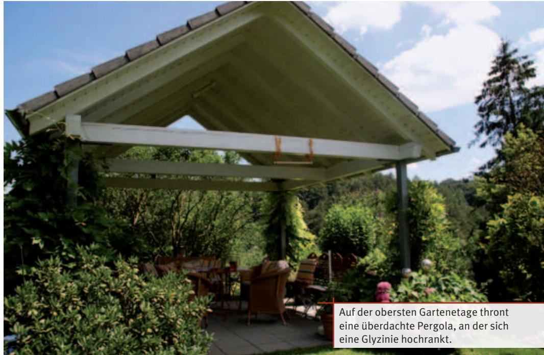
Auf der obersten Gartenetage thront eine überdachte Pergola, an der sich eine Glyzinie hochrankt.

Zum Grundstück, das insgesamt etwas weniger als 4000 Quadratmeter umfasst, gehört auch eine Waldpartie. Die hohen Tannen bilden einen dunklen Hintergrund, vor dem sich der Garten mit seinen leuchtenden Blumen wie ein Juwel abhebt. In den schattigen Partien entlang des Waldrandes gedeihen prächtige Farne und zahlreiche Hortensien. Sie blühen in allen Farbnuancen von Weiss über sanftes Blaurosa bis hin zum leuchtenden Pink. Der Farbmix ist zufällig entstanden, denn die meisten Hortensien sind Geschenke von Bekannten und Freunden. Begleitet von Buchsbäumen, die zu regelrechten Pflanzenskulpturen geformt sind, führt ein schmaler Kiesweg zurück in den oberen Gartenteil. Die Hanglage des Geländes wurde geschickt genutzt, um verschiedene Ebenen zu schaffen, die von geschwungenen Natursteinmauern gestützt und durch gepflasterte Treppen verbunden sind. Immer wieder finden sich Sitzgelegenheiten mit kleinen Bistrotischen und dekorativen Laternen. Auf der obersten Gartenetage thront eine überdachte Pergola, an deren Metallstützen sich eine Glyzinie hochrankt. Gefragt nach ihrem Lieblingsplatz,