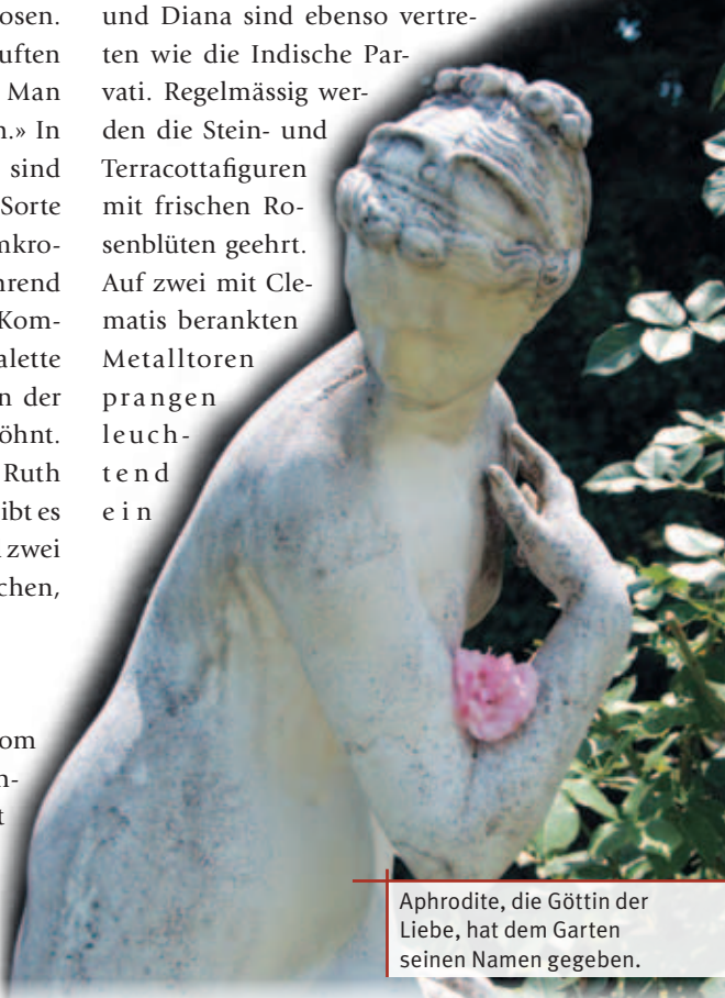
Aphrodite, die Göttin der Liebe, hat dem Garten seinen Namen gegeben.

und Diana sind ebenso vertreten wie die Indische Parvati. Regelmässig werden die Stein- und Terracottafiguren mit frischen Rosenblüten geehrt. Auf zwei mit Clematis berankten Metalltoren prangen leuchtend ein