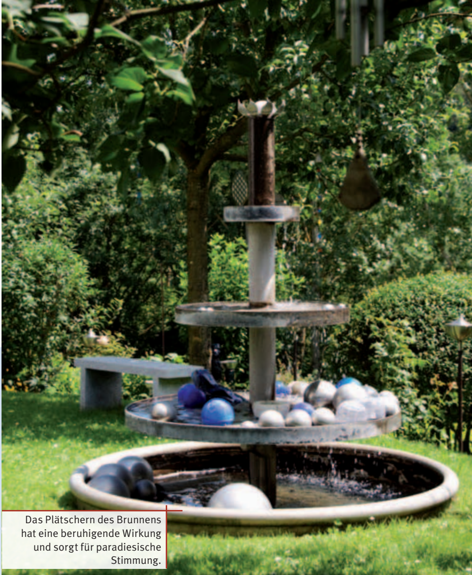
Das Plätschern des Brunnens hat eine beruhigende Wirkung und sorgt für paradiesische Stimmung.

so. Einst, so erzählt die deutsche Schauspielerin mit Wurzeln in der Tschechoslowakei, war das Grundstück hinter ihrem Wohnhaus eine Müllhalde. Glasflaschen, kaputte Plastikbehälter, sogar ausgediente Traktorräder waren hier achtlos entsorgt worden. Der ehemalige Obstgarten war kaum mehr als solcher zu erkennen, die wilden Schösslinge der Zwetschgenbäume hatten die ganze Wiese eingenommen und sprossen hinauf in die Baumkronen. Ruth Maria Kubitschek konnte das Landstück vor über zehn Jahren kaufen und schaffte darauf ihr eigenes Paradies. «Ich habe den Garten als Dankeschön für die Erde gebaut. Wir dürfen nicht nur nehmen, wir müssen auch etwas zurückgeben», erzählt sie. Wenn sie jeweils von längeren Dreharbeiten nach Hause komme, schaue sie sich in ihrem Garten um und könne es kaum fassen, wie schön sie es hier habe.