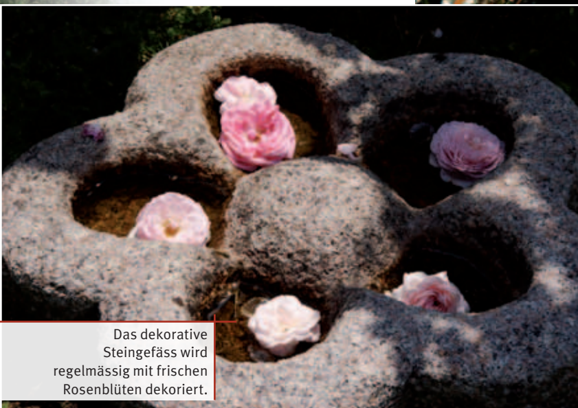
Das dekorative Steingefäss wird regelmässig mit frischen Rosenblüten dekoriert.