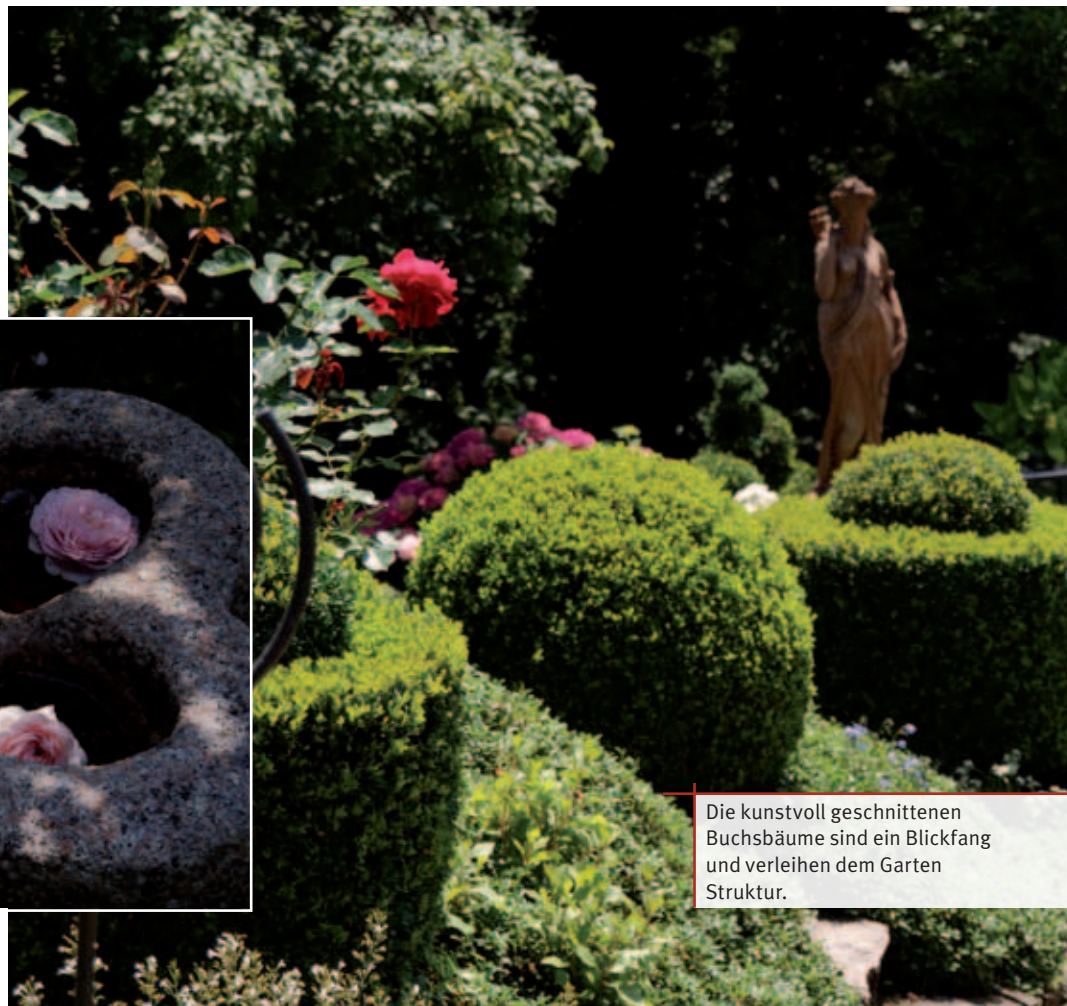
Die kunstvoll geschnittenen Buchsbäume sind ein Blickfang und verleihen dem Garten Struktur.

Mit einem Strahlen in den Augen schaut sie den blühenden Abhang hinunter. «Neben der Arbeit spielt der Garten die nächst grössere Rolle in meinem Leben», so Ruth Maria Kubitschek. Knorrige Obstbäume, umspielt von Rosen und Hortensien, strukturieren den harmonischen Garten. Das war nicht immer